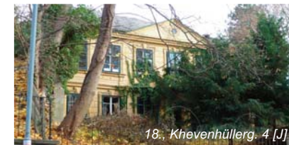
18., Khevenhüllerg. 4 [J]

* Denkmalschutz muss Bundeskompetenz bleiben – darf nicht „verländert“ werden