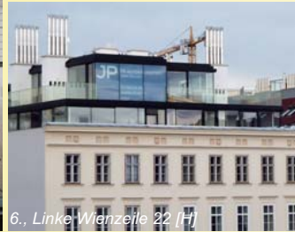
6., Linke Wienzeile 22 [H]

Wir fordern Transparenz und Auskunftspflicht, umfassenden Informationszugang sowie Parteilichkeit für NGOs zur Wahrnehmung des öffentlichen Interesses in allen den Kulturgüter- und Umweltschutz sowie die Raumordnung (insbesondere Widmungen) betreffenden Verfahren.