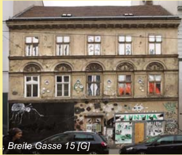
7., Breite Gasse 15 [G]