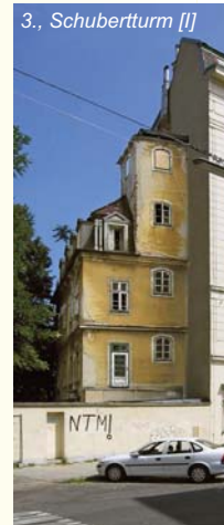
3., Schubertturm [I]

* Verschärfung von Strafen bei rechtswidrigem Abriss oder Veränderung historisch wertvoller Häuser im Sinne einer tatsächlich abschreckenden Wirkung (wie die Wiederherstellung eines zerstörten Hauses)