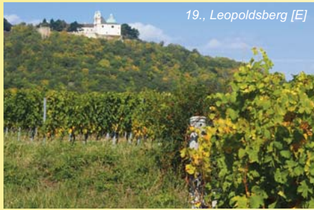
19., Leopoldsdorf [E]

Weitere prominente Unterstützer finden Sie auf unserer Website www.kulturerbewien.at