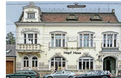
22., Donaufelderstr. 24 [L]