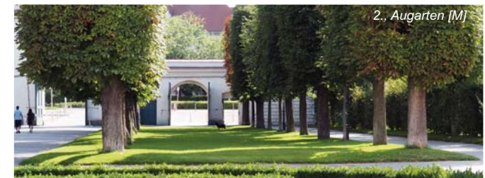
2., Augarten [M]