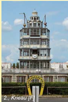
2., Kriemhild [F]